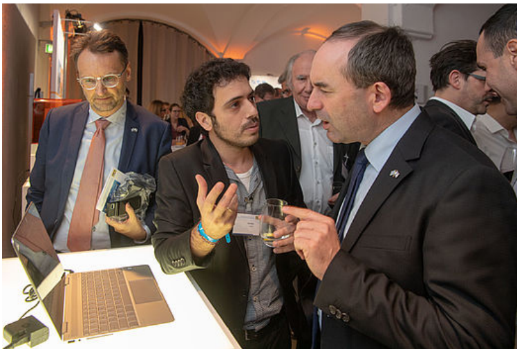
Bayerns Wirtschaftsminister Hubert Aiwanger spricht mit den bayerisch-israelischen Kooperationsunternehmen.