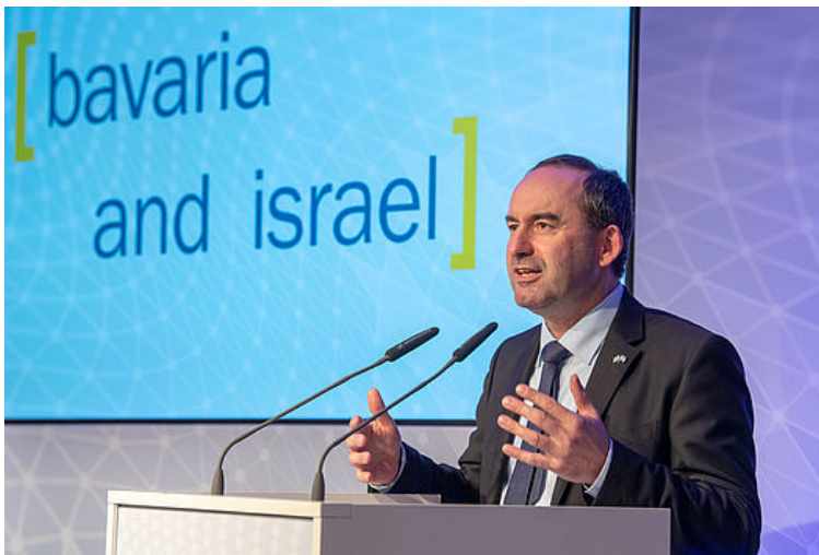
Bayerns Wirtschaftsminister Hubert Aiwanger hält eine Rede bei der Jubiläumsfeier anlässlich des 70. Gründungsjahres des Staates Israel.