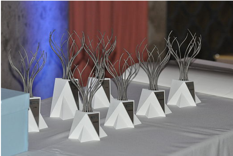
Die Pokale für die Gewinner des Innovationspreises Bayern 2018 im Deutschen Museum in München.