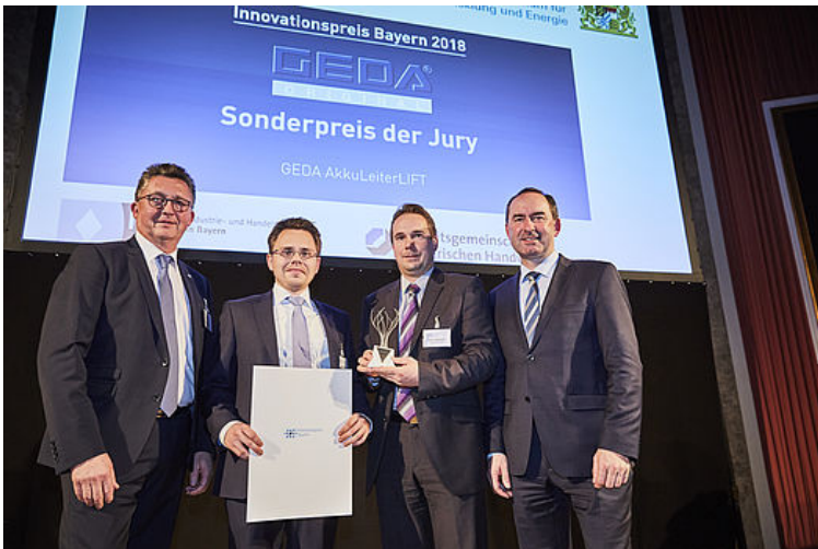
Den Sonderpreis der Jury des Innovationspreises Bayern 2018 erhielt die GEDA-Dechentreiter GmbH & Co.KG .