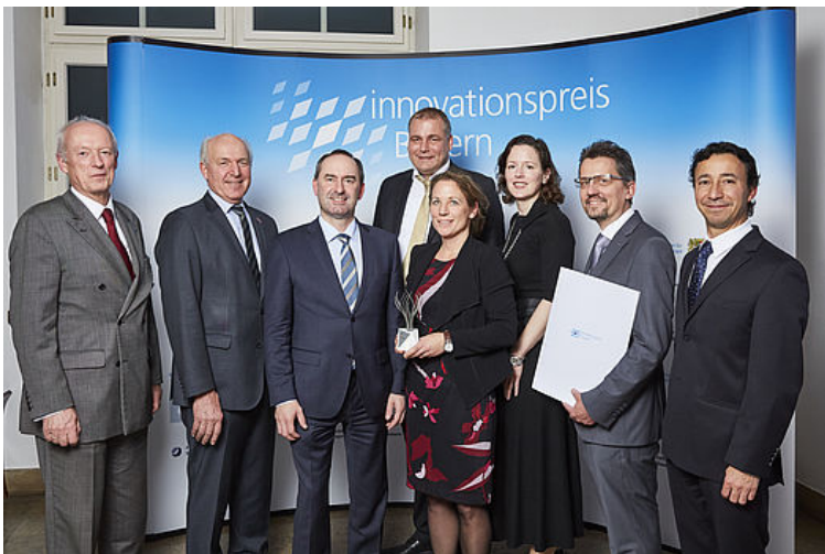
Die Sonderpreisgewinner in der Kategorie Start-up mit einem Alter bis zu 5 Jahren von der Roboception GmbH zusammen mit Bayerns Wirtschaftsminister Hubert Aiwanger und Franz Xaver Peteranderl, Präsident der Handwerkskammer für München und Oberbayern, beim Innovationspreis Bayern 2018 im Deutschen Museum in München.