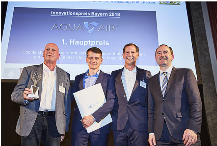
Die Gewinner von der Aquaair GmbH & Co. KG mit dem ersten Hauptpreis des Innovationspreises Bayern 2018 zusammen mit Bayerns Wirtschaftsminister Hubert Aiwanger bei der Verleihung im Deutschen Museum in München.