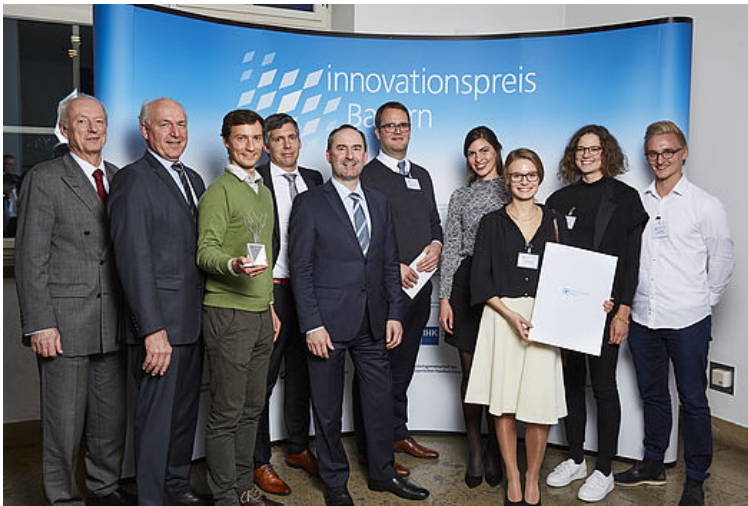
Die Gewinner von der Medineering GmbH mit dem zweiten Hauptpreis des Innovationspreises Bayern 2018 zusammen mit Bayerns Wirtschaftsminister Hubert Aiwanger und Franz Xaver Peteranderl, Präsident der Handwerkskammer für München und Oberbayern, bei der Verleihung im Deutschen Museum in München.