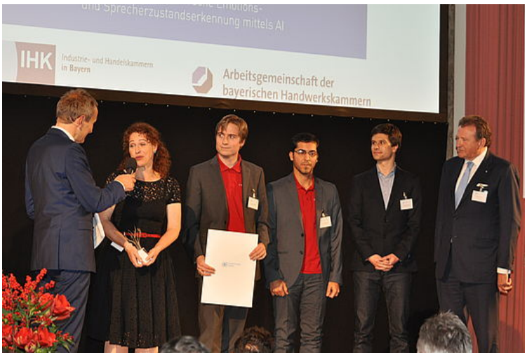
Die Gewinner von der Audeering GmbH mit dem dritten Hauptpreis des Innovationspreises Bayern 2018 zusammen mit Dr. Eberhard Sasse, Präsident der IHK für München und Oberbayern, bei der Verleihung im Deutschen Museum in München.