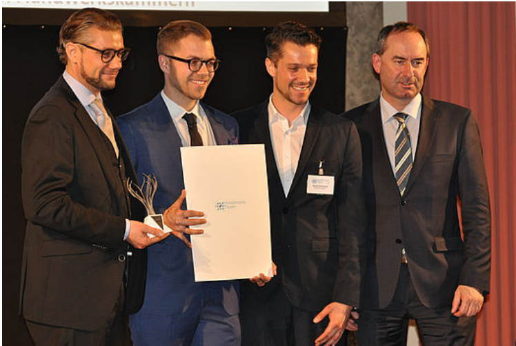
Die Sonderpreisgewinner in der Kategorie Kooperation Wirtschaft und Wissenschaft von der Tacterion GmbH und Bayerns Wirtschaftsminister Hubert Aiwanger beim Innovationspreis Bayern 2018 im Deutschen Museum in München.