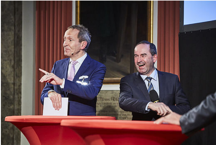
v.l.n.r.: Moderator Tilmann Schöberl und Bayerns Wirtschaftsminister Hubert Aiwanger bei der Verleihung des Innovationspreises Bayern 2018 im Deutschen Museum in München.