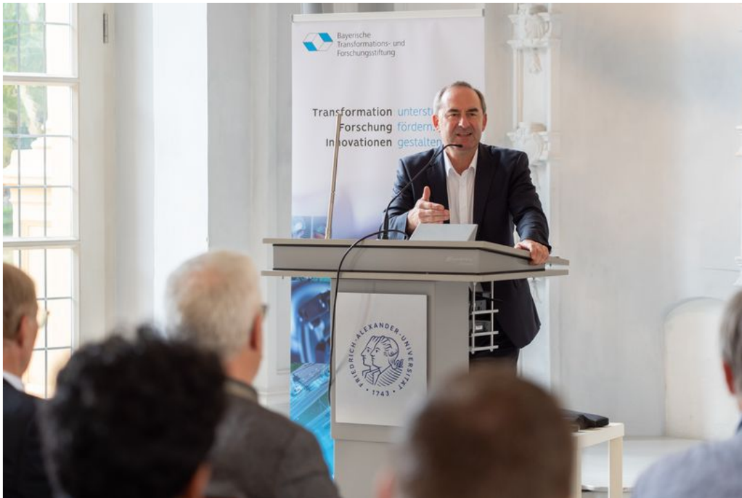
In seiner Rede betonte Bayerns Wirtschaftsminister Hubert Aiwanger das große Potenzial von Kleinstsatelliten für Kommunikation, Erdbeobachtung und Sicherheit.