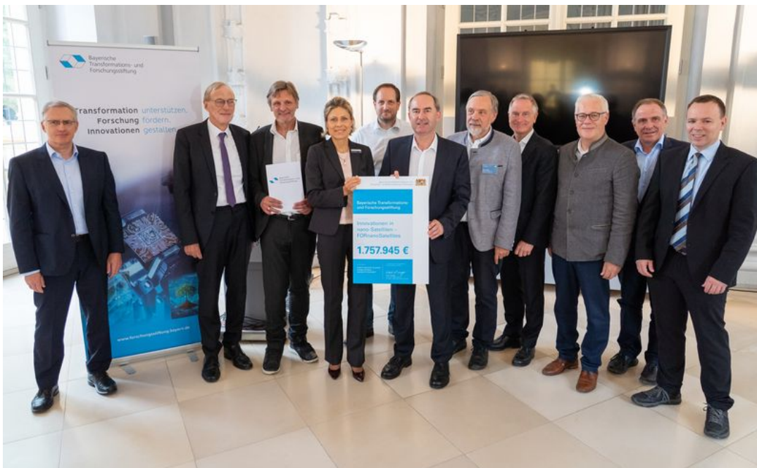
Bayerns Wirtschaftsminister Hubert Aiwanger hat heute einen Förderbescheid über knapp 1,8 Millionen Euro an den Forschungsverbund FORnanoSatellites übergeben.