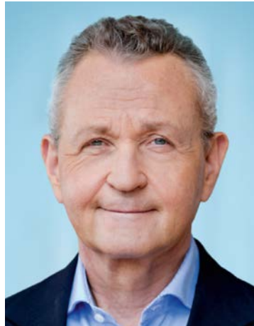
Hubert Aiwanger Bayerischer Staatsminister für Wirtschaft, Landesentwicklung und Energie