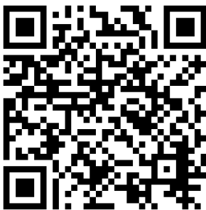
Abbildung 6 QR Code – Veranstaltungen im Rahmen des Modellprojekts

Die nächsten Veranstaltungen des erweiterten Erfahrungsaustauschs finden Sie aktuell immer unter www.cima.de , Sucheingabe: Modellprojekt Digitale Einkaufsstadt.