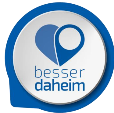
Abbildung 5 Logo Dachmarke „besser daheim“

Der zeitliche Rahmen ist durch die Laufzeit des Projekts „Digitale Einkaufsstadt Bayern“ und die im Mai 2017 beginnende „Kleine Landesgartenschau“ geprägt. Das Label für „besser daheim“ wurde inhaltlich und grafisch fertiggestellt und ist einsatzbereit.